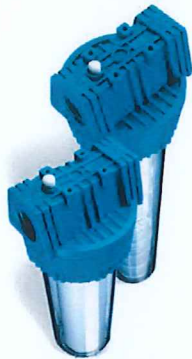
Contenitori per cartucce serie FP3 standard testa senza inserto ottone vaso san trasparente FP3 filter cartridge housing without brass insert and transparent sump