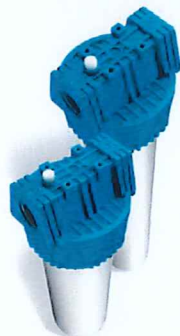
Contenitore per cartucce serie FP3 standard testa senza inserto ottone vaso opaco bianco FP3 filter cartridge housing without brass insert and opaque white sump